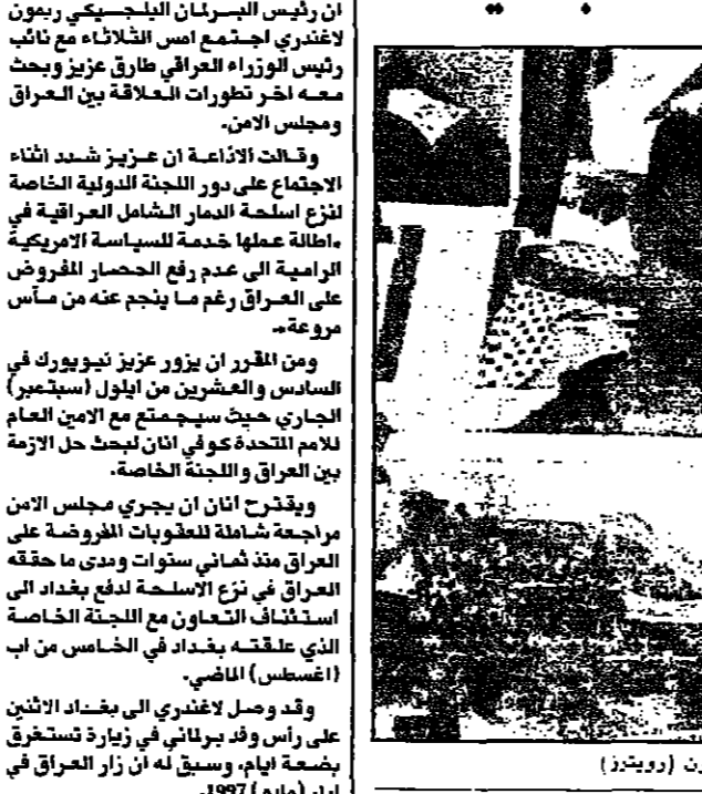
عراقيون يتابعون انباء الأزمة مع الامم المتحدة وشهادة كلينتون

بغداد - اف ب - أعلنت اذاعة بغداد ان رئيس البرلمان البلجيكي رينوس يوزر بغداد.